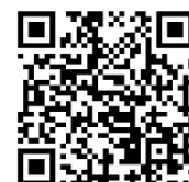
厚生労働省 疑義解釈(Q&A)

また、9月11日付で疑義解釈資料(Q&A)が発出しております。こちらに、『往療』や『訪問施術』の取り扱い方法や、特別地域加算の対象地域が確認できるHPのリンク、療養費支給申請書の記入方法等に関するQ&Aが記載されています。療養費を取り扱われる方は、必ずご確認ください。