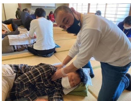
どうよ!? 奥義をマスターできた、、、かも