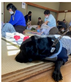
みんな練習がんばれ。 ボクはひと休みだ。ワン。