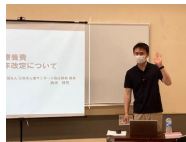
角本講師がパワーポイントを使って記入例を詳細説明