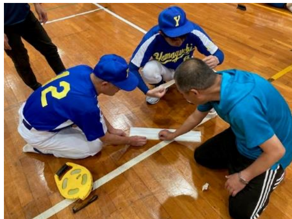
ピッチャープレートもOK！