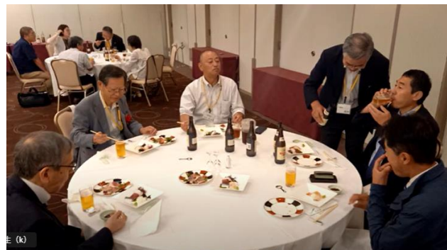
来賓の皆様も交流のひとときをなごやかに

翌日の見学会は10名が参加。朝9時に仙台駅を出発して、仙石線の松島海岸駅から瑞巖寺前にある松島港へ。松島港から塩釜港マリングートまで約1時間の芭蕉の句で有名な松島湾クルーズ。塩釜港ではマリングートから駅前のイオンタウンまで、歩道橋としてつながっている津波避難デッキを体験。（全長372m、幅4.8m、高さ6.5m）