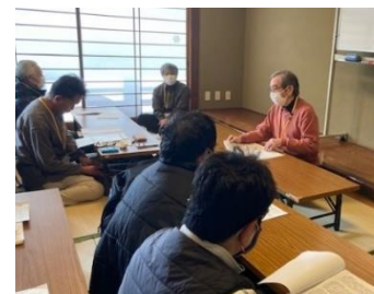
安田会長が日マ会の現状を報告