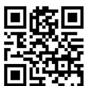
日マ会 メールアドレス

【日マ会会員限定配信 解説YouTube動画】「あはき療養費、10月からの新制度と療養費支給申請書の書き方」