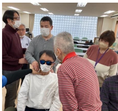
視覚障害者同士なので、施術をする位置や、押圧など声を掛け、互いに触れながら確認し、実技研修を行う。