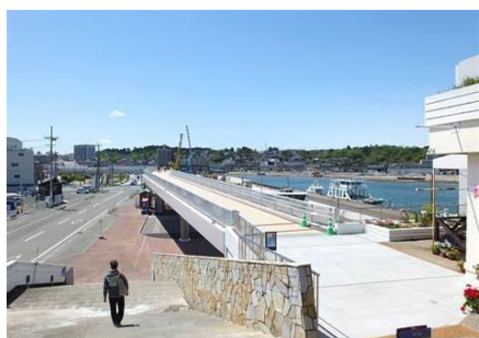
マリングートから駅方面へ

翌日の見学会は10名が参加。朝9時に仙台駅を出発して、仙石線の松島海岸駅から瑞巖寺前にある松島港へ。松島港から塩釜港マリングートまで約1時間の芭蕉の句で有名な松島湾クルーズ。塩釜港ではマリングートから駅前のイオンタウンまで、歩道橋としてつながっている津波避難デッキを体験。（全長372m、幅4.8m、高さ6.5m）