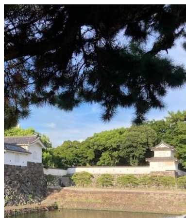
会場のすぐそばには、府内城跡が。