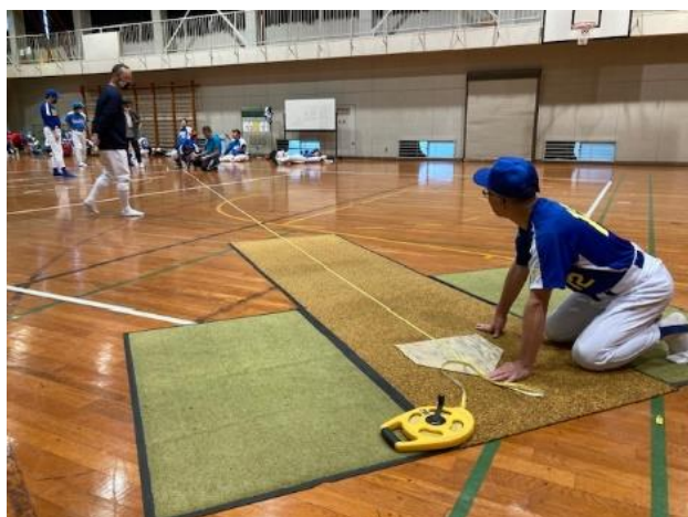
マウンド間の距離をキッチリと計測