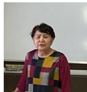
麻生会長が代表挨拶