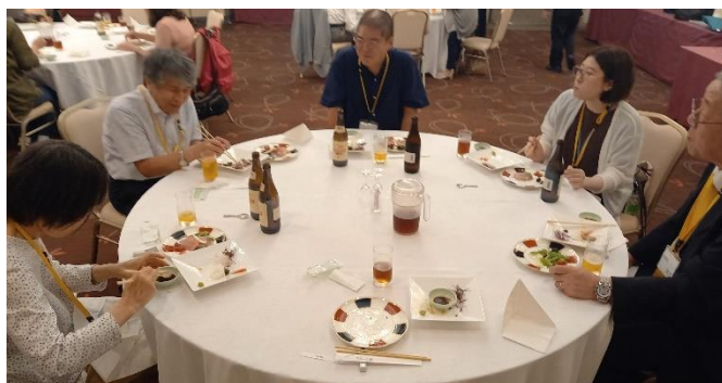
北海道から九州までのメンバーが楽しく交流