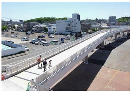
歩道橋の高さがずっと続く