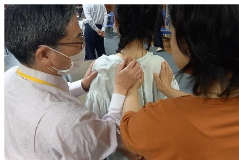
学生さんたちに正しい施術位置を指導