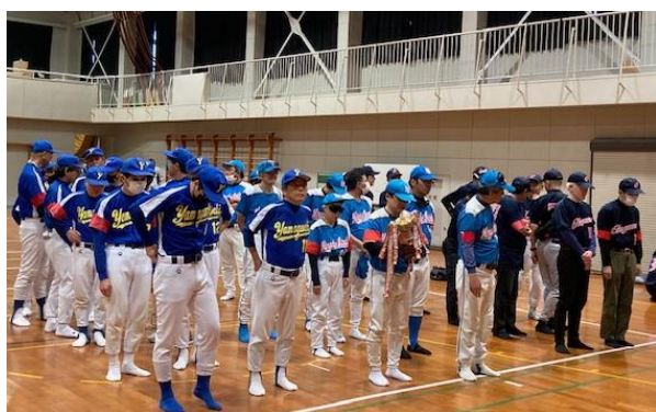
山口県、岡山県、広島県チーム、全員整列