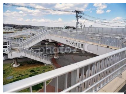
途中からも避難路へ上れる

その後は、東北鎮護・陸奥国一宮の「鹽竈（しおがま）神社」を参拝し散策ののち鹽竈神社博物館を見学。展示されている祭礼の際に山上から海上渡御に担がれる神輿の大きさにびっくり。