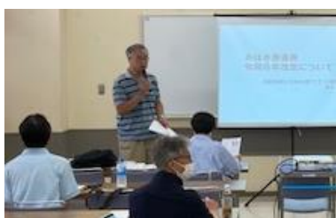
千葉県田村会長が進行